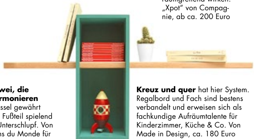
Kreuz und quer hat hier System. Regalbord und Fach sind bestens verbandelt und erweisen sich als fachkundige Aufräumtalente für Kinderzimmer, Küche & Co. Von Made in Design, ca. 180 Euro