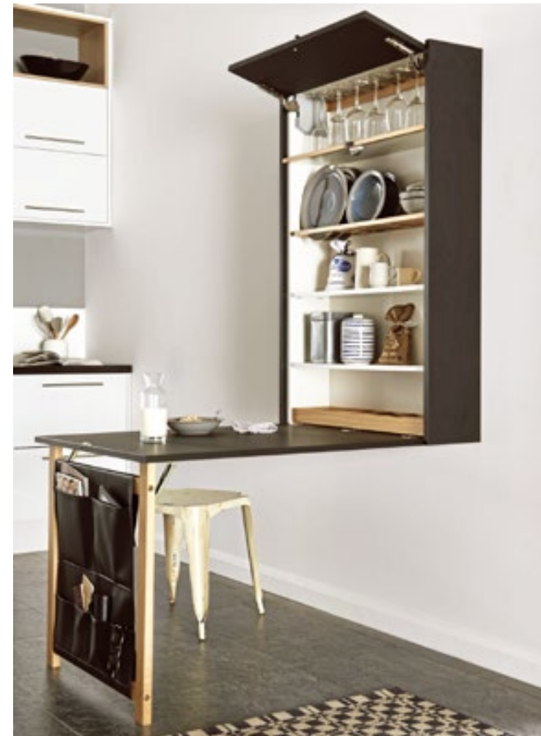
Ein echtes Fliewatüüt unter den Allroundtalenten: „Table Plus“ kann Tisch, Regal & Stauraum sein und lässt sich an der Wand zusammenfalten. Von Magnet für ca. 400 Euro