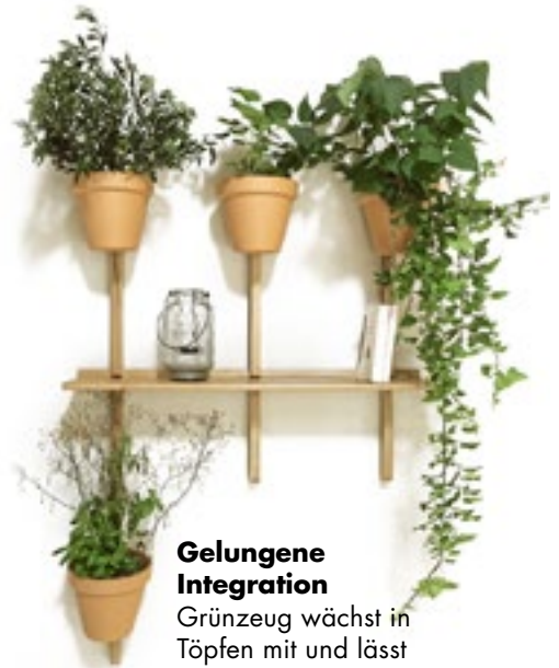
Gelungene Integration Grünzeug wächst in Töpfen mit und lässt das Regal weniger raumgreifend wirken. „Xpot“ von Compagnie, ab ca. 200 Euro