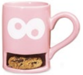
Krümelmonster Schmuggelt Nervennahrung in lange Meetings. Tasse von Donkey Products, ca. 15 Euro

Ordnung mögen alle, aufräumen die wenigsten. Höchste Zeit für clevere Möbel, die mithelfen. Nach dem Motto: aus den Augen, aus dem Sinn!