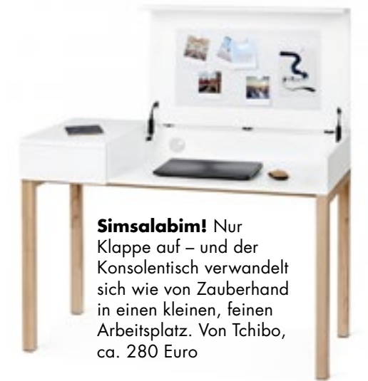
Simsalabim! Nur Klappe auf – und der Konsolentisch verwandelt sich wie von Zauberhand in einen kleinen, feinen Arbeitsplatz. Von Tchibo, ca. 280 Euro