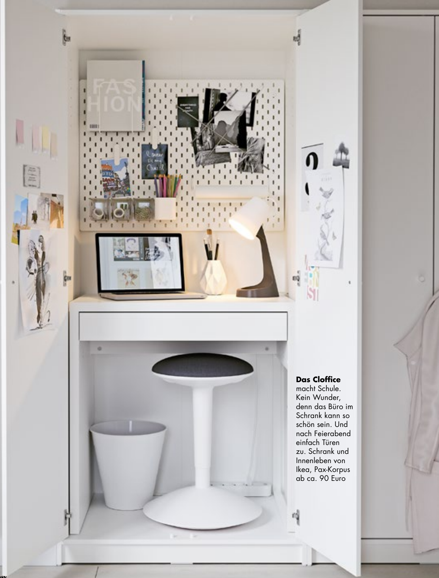
Das Cloffice macht Schule. Kein Wunder, denn das Büro im Schrank kann so schön sein. Und nach Feierabend einfach Türen zu. Schrank und Innenleben von Ikea, Pax-Korpus ab ca. 90 Euro