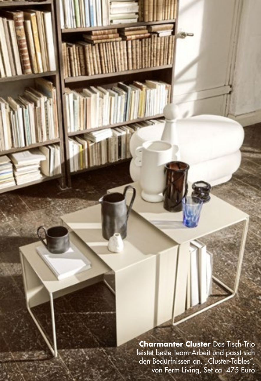
Charmanter Cluster Das Tisch-Trio leistet beste Team-Arbeit und passt sich den Bedürfnissen an. „Cluster-Tables“, von Ferm Living, Set ca. 475 Euro