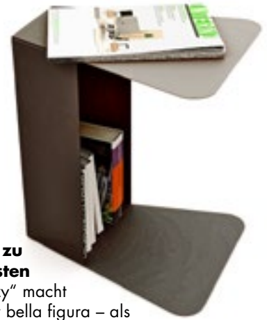
Stets zu Diensten „Soozy“ macht immer bella figura – als Sammelstelle für Zeitschriften oder als Nachttischchen. Von Caoscreo für ca. 190 Euro