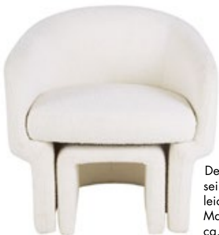
Zwei, die harmonieren Der Sessel gewährt seinem Fußteil spielend leicht Unterschlupf. Von Maisons du Monde für ca. 400 Euro